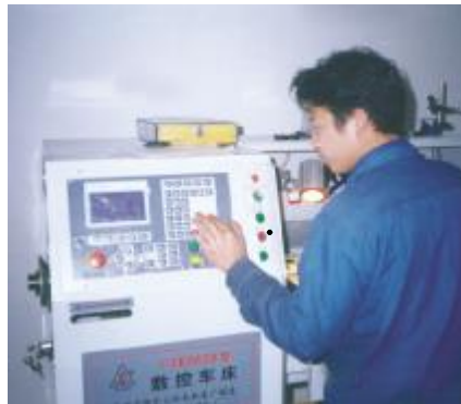
特殊零件数控机床加工