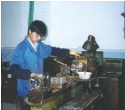
一般零件普通机床加工