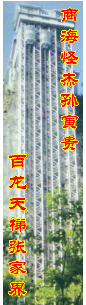
亿万富翁孙寅贵 聪明利用高科技 亲自采购MTC